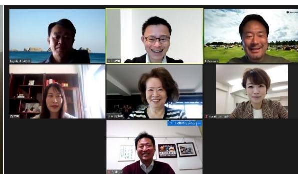
「あゆみ」冊子編纂委員会の様子（4月11日）